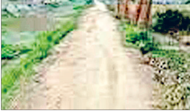
महेन्द्रगढ़। कच्चे रास्ते का फाइल फोटो।

अब सरकार की ओर से 17 गांवों के कच्चे रास्तों को पक्का करने की मंजूरी मिलने से ग्रामीणों को काफी फायदा मिलेगा। सरकार द्वारा सड़क निर्माण कार्य जल्द करवाया जाएगा।