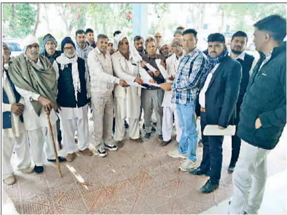
भिवानी। एसडीएम प्रवाचक को ज्ञापन देते नीमड़ बडेसरा के ग्रामीण।