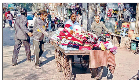
महेन्द्रगढ़। अभियान के दौरान बाजार से रेहड़ी लेकर भागता रेहड़ी चालक।

नगर पालिका टीम द्वारा मंगलवार को शहर में अतिक्रमण हटाओ अभियान चलाया गया। टीम ने विभिन्न बाजारों में दौरा कर दुकानों के बाहर रखा सामान जप्त किया। टीम के बाजार में आने से दुकानदारों में हड़कंप मच गया। नगर पालिका अधिकारियों के निर्देश पर चलाए गए अभियान का उद्देश्य सड़कों को खाली कराना और यातायात जाम से निजात दिलाना है। वहीं अतिक्रमण विरोधी टीम ने मुख्य बाजारों के दुकानदारों को अपनी दुकानों के बाहर सामान न रखने की सख्त हिदायत दी। इस दौरान कई दुकानों के बाहर पड़ा सामान जप्त किया गया। यह अभियान नगर पालिका कार्यालय से शुरू होकर शंकर मार्केट, बालाजी चौक, विश्वकर्मा चौक, सीएसडीए कैंटीन, बस स्टैंड, राव तुलाराम चौक से वापिस आंबेडकर चौक से नगर पालिका कार्यालय में जाकर समाप्त हुआ। इसके साथ