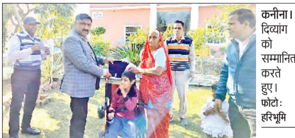
कनीना। दिव्यांग को सम्मानित करते हुए।