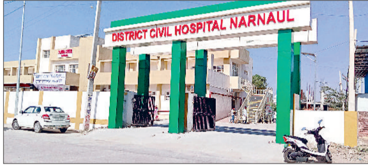
नारनौल। जिला नागरिक अस्पताल।

उल्लेखनीय है कि नेशनल क्वालिटी एसुरेंस स्टैंडर्स के अनुसार हर साल अलग-अलग विभाग का सर्टिफिकेशन किया जाता है। इसमें स्वास्थ्य सेवाएं भी शामिल हैं। जिसकी शुरूआत जिला स्तर से होती है। जिला स्तर पर क्वालीफाई करने पर स्टेट प्रतियोगिता में भाग लेना होता है। इसी