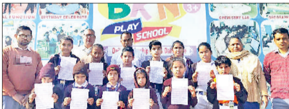
नारनौल। विजेता विद्यार्थियों को सम्मानित करते हुए।